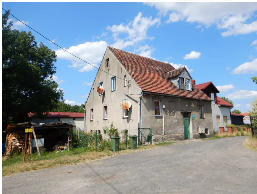
Ogólny widok budynku

na sprzedaż lokalu mieszkalnego Nr 4 znajdującego się w budynku położonym w Lubaniu przy ul. Włókienniczej 5A wraz z udziałem we współwłasności nieruchomości gruntowej (działka nr 57/13, AM 18, Obręb II o powierzchni 478 m 2 , JG1L/00028431/2)